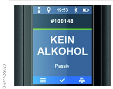
2,4" Farbdisplay zur Anzeige von Informationen, Hinweisen und Warnungen