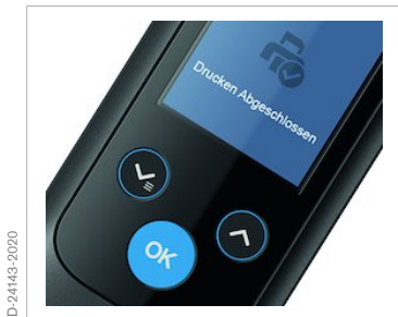
einfaches Drucken per Knopfdruck