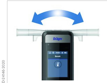
Mundstückaufnahme von links wie von rechts möglich