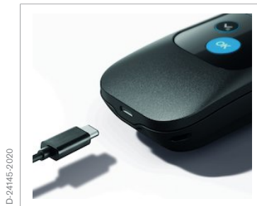
USB-C Schnittstelle für einfaches Laden (stationär oder im Fahrzeug)