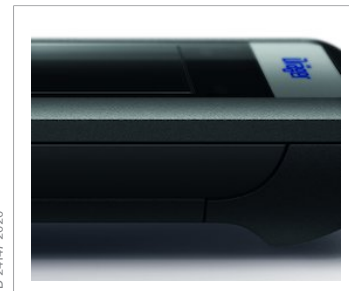
Gummierte Griffzone für den sicheren Halt