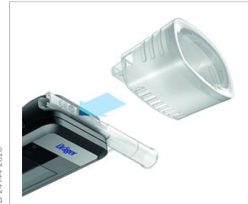
Schnelles Umschalten vom Trichter- zum Mundstück-Test