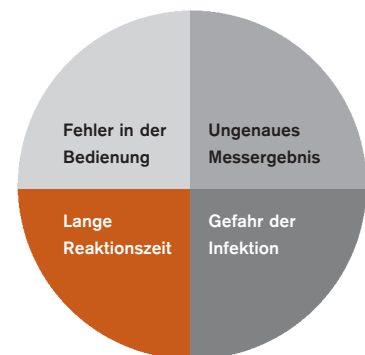
Hauptproblemfelder in der Anwendung von Alkoholmessgeräten

In solchen Situationen zählen nur eine starke Persönlichkeit und erstklassige Ausrüstung. Ausrüstung, die Bedienfehler oder lange Reaktionszeiten nicht zulässt. Ausrüstung, die hundertprozentig verlässliche Daten liefert und gleichzeitig allen Handelnden höchste Sicherheit bietet. Ausrüstung, wie das aus Jahrzehnten Erfahrung und modernster Technologie völlig neu entwickelte Dräger Alcotest® 6510.